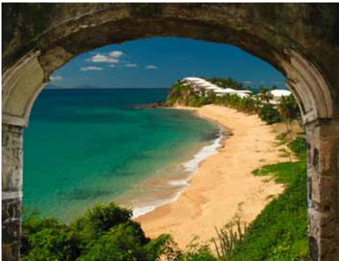
Portale öffnen den Ausblick