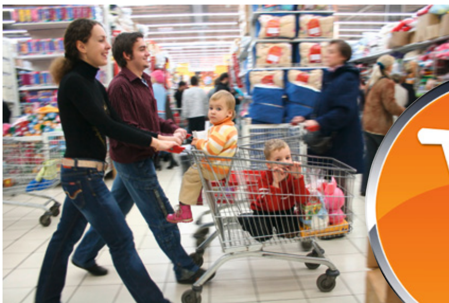
Vom Offline Shop zum Online Shop